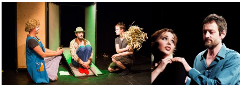
BUDAPESTI ANARCHISTA SZÍNHÁZ: ZÖLD SZOFI / TÖBBSZÖRÖS ORGAZMUS A BEMUTATÓ ÓTA 61 ELŐADÁS 55 LEJÁTSZOTT ELŐADÁS