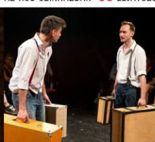
KÖVEK AZ RS9 SZÍNHÁZBAN 47 ELŐADÁS