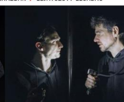
A VARJÚKIRÁLY 9 ELŐADÁS SZÍNHÁZUNKBAN