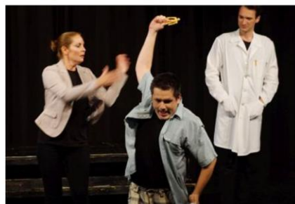
A BEMUTATÓ ÓTA 3 LEJÁTSZOTT ELŐADÁS