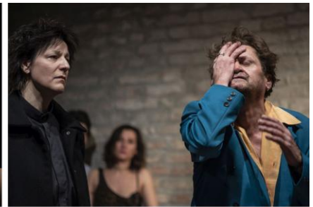
CSIKÓS-MENSZÁTOR: BUDAPEST FÖLÖTT AZ ÉG A BEMUTATÓ ÓTA 39 LEJÁTSZOTT ELŐADÁS