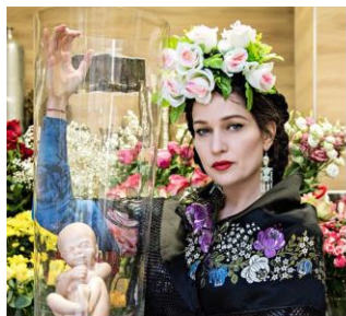
ANYASZÍNHÁZ: FRIDA KAHLO BALLADÁJA AZ RS9 SZÍNHÁZBAN 43 LEJÁTSZOTT ELŐADÁS