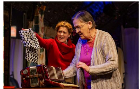
KELLER-FELVIDÉKI: TOPRONGYÓZÓ A BEMUTATÓ ÓTA 18 LEJÁTSZOTT ELŐADÁS