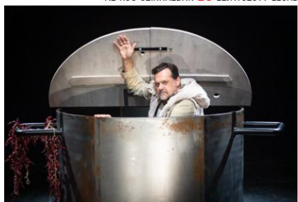
NEPTUN BRIGÁD: A PACAL IDEJE AZ RS9 SZÍNHÁZBAN 28 LEJÁTSZOTT ELŐADÁS A BEMUTATÓ ÓTA