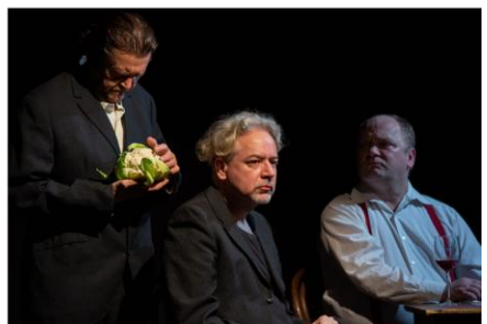
RILKE: MALTE LAURIDS BRIGGE A BEMUTATÓ ÓTA 17 LEJÁTSZOTT ELŐADÁS