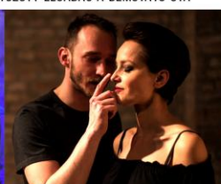
EGY PERCCSEL TOVÁBB 64 LEJÁTSZOTT ELŐADÁS