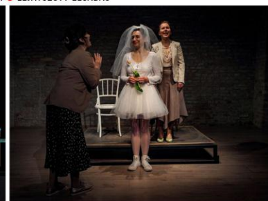
KV TÁRSULAT: TULIPÁN AZ RS9 SZÍNHÁZBAN 7 LEJÁTSZOTT ELŐADÁS