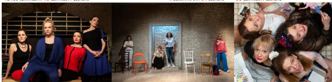
E-MANCIK SZÍNHÁZI M.: SZOMJAS FÉRFIAK SÖRT ISZNAK HELYETTEM / VERSLÁBAK HAZAFELÉ / VERSLÁBAK NECCHARISNYÁBAN / VÁLOGATÁSKAZI AZ RS9 SZÍNHÁZBAN 33 LEJÁTSZOTT ELŐADÁS BEMUTATÓ ÓTA 10 ELŐADÁS 32 LEJÁTSZOTT ELŐADÁS 19 ELŐADÁS