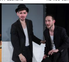
STÍLGYAK 16 ELŐADÁS AZ RS9 SZÍNHÁZBAN