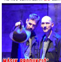
MÁSİK PRODUKCIÓ: AZ ÓCEÁNJÁRÓ A BEMUTATÓ ÓTA 35 ELŐADÁS